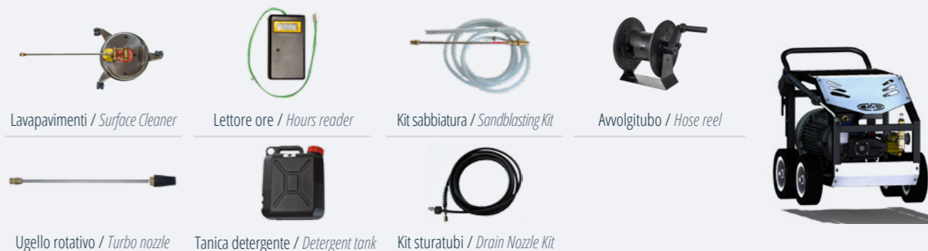
Lavapavimenti / Surface Cleaner